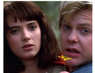
1988 MILLE NEUF CENT SOIXANTE NEUF (1969) d'Ernest Thompson avec Kiefer Sutherland