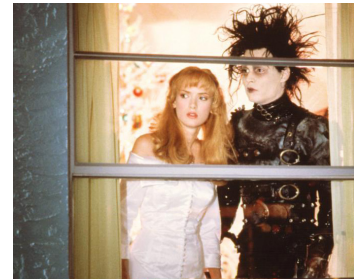
1990 EDWARD AUX MAINS D'ARGENT (Edward Scissorhands) de Tim Burton avec Johnny Depp