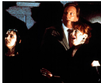
1988 BEETLEJUICE (Beetlejuice) de Tim Burton avec Jeffrey Jones, Catherine O'Hara