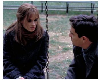
2000 LES ÂMES PERDUES (Lost Souls) de Janusz Kaminski avec Ben Chaplin