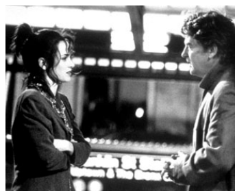
1998 CELEBRITY (Celebrity) de Woody Allen avec Kenneth Branagh