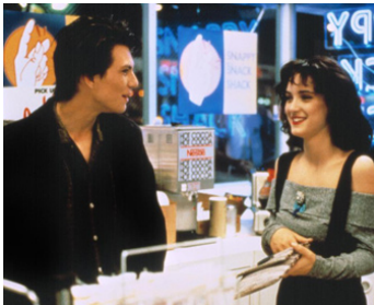
1988 FATAL GAMES (Heathers) de Michael Lehmann avec Christian Slater