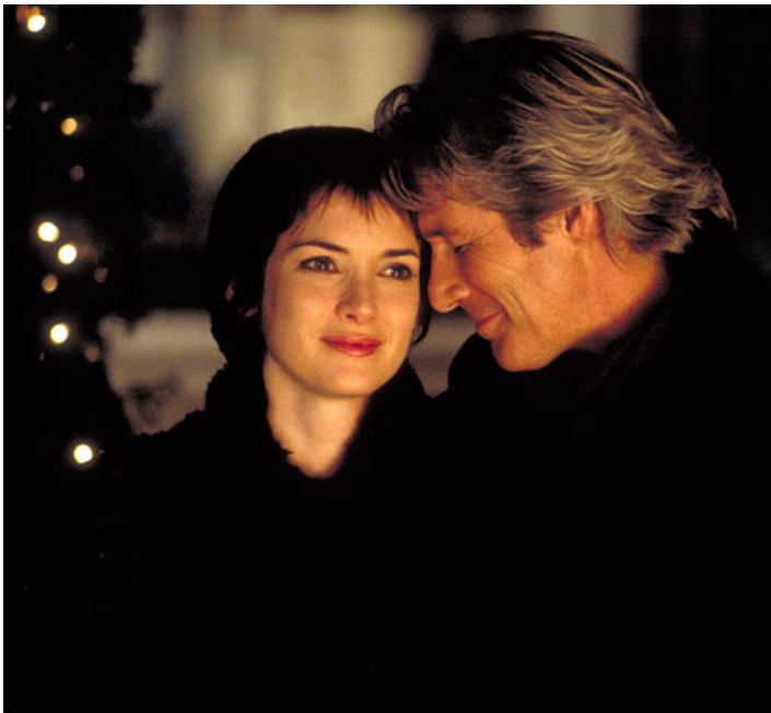
2000 UN AUTOMNE À NEW YORK (Autumn in New York) de Joan Chen avec Richard Gere