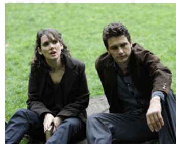
2012 THE LETTER (The Letter) de Jay Anania avec James Franco