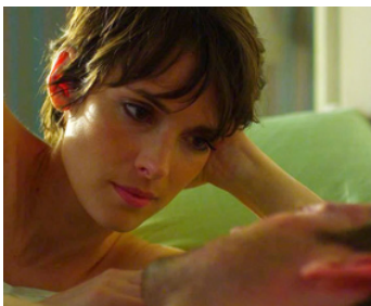
2009 STAY COOL (Stay Cool) de Michael Polish avec Michael Polish