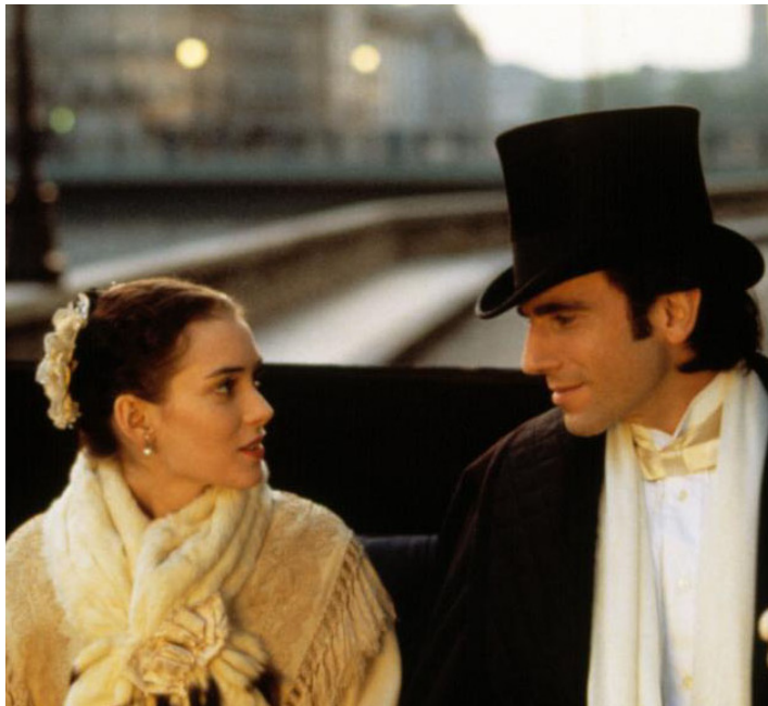
1993 LE TEMPS DE L'INNOCENCE (The Age of Innocence) de Martin Scorsese avec Daniel Day-Lewis