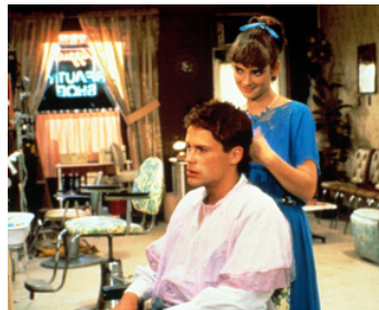
1987 SQUARE DANCE (Square Dance) de Daniel Petrie avec Rob Lowe