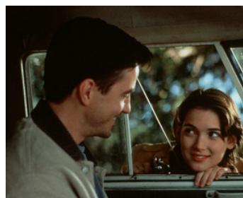
1995 LE PATCHWORK DE LA VIE (How to make an American Quilt) de J. Moorehouse avec D. Mulroney