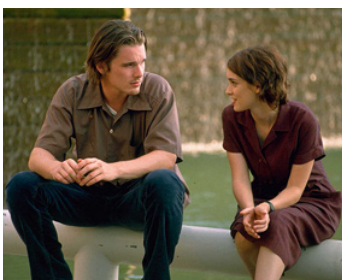
1994 GÉNÉRATION 90 (Reality Bites) de Ben Stiller avec Ethan Hawke