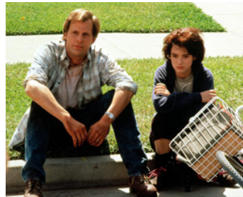
1990 ROXY EST DE RETOUR (Welcome Home, Roxy Carmichael) de Jim Abrahams avec Jeff Daniels