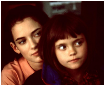
1991 LES DEUX SIRÈNES (Mermaids) de Richard Benjamin avec Christina Ricci