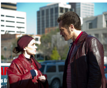
2012 THE ICEMAN (The Iceman) d'Ariel Vromen avec Michael Shannon