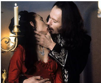
1992 DRACULA (Dracula) de Francis Ford Coppola avec Gary Oldman