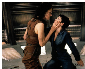
1997 ALIEN, LA RÉSURRECTION (Alien Resurrection) de J.-P. Jeunet avec S. Weaver