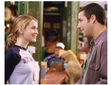
2002 LES AVENTURES DE MISTER DEEDS (Mr Deeds) de Steven Brill avec Adam Sandler