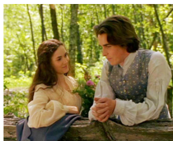
1994 LES 4 FILLES DU DR MARCH (Little Women) de Gillian Armstrong avec Christian Bale