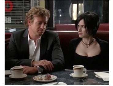
2007 SEX AND DEATH 101 (Sex and Death 101) de Daniel Waters avec Simon Baker