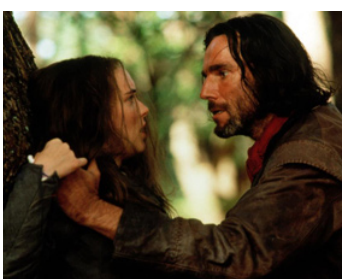
1996 LA CHASSE AUX SORCIÈRES (The Crucible) de Nicolas Hytner avec Daniel Day-Lewis