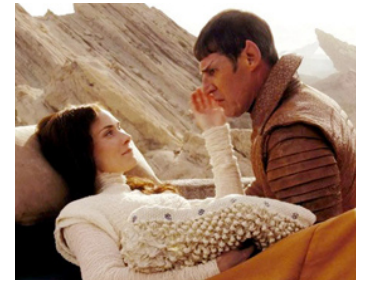
2009 STAR TREK (Star Trek) de J. J. Abrams avec Leonard Nimoy