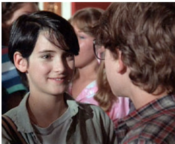
1986 LUCAS (Lucas) de David Seltzer avec Corey Haim