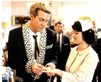
1989 GREAT BALLS OF FIRE ! (Great Balls of Fire) de Jim McBride avec Dennis Quaid