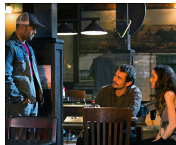
2013 HOMEFRONT (Homefront) de Gary Fleder avec Jason Statham, James Franco