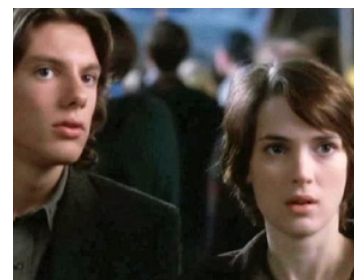
1996 LE DORTOIR DES GARÇONS (Boys) de Stacy Cochran avec Lukas Haas