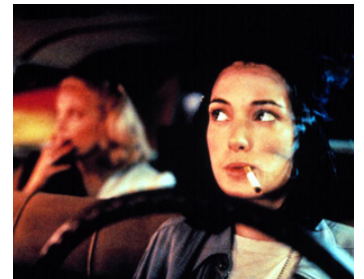
1991 UNE NUIT SUR LA TERRE (Night on Earth) de Jim Jarmush avec Gena Rowlands