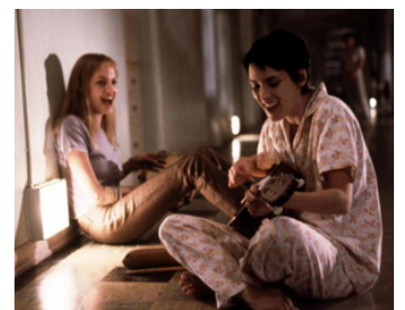
1999 UNE VIE VOLÉE (Girl, interrupted) de James Mangold avec Angelina Jolie