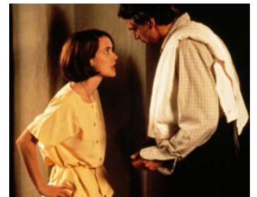
1993 LA MAISON AUX ESPRITS (The House of the Spirits) de Bille August avec Jeremy Irons