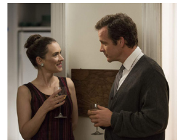
2015 EXPERIMENTER (Experimenter) de Michael Almeroyda avec Peter Sarsgaard