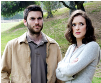
2008 THE LAST WORLD (The Last World) de Geoffrey Haley avec Wes Bentley