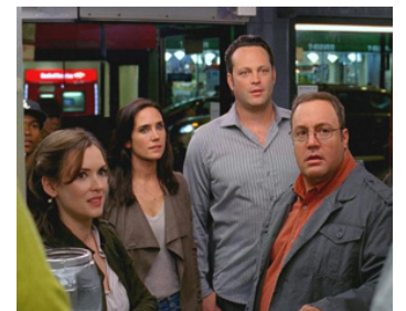
2011 LE DILEMME (The Dilemma) de Ron Howard avec J. Connelly, Vince Vaughn, Kevin James