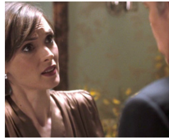
2008 THE INFORMERS (The Informers) de Gregor Jordan avec Billy Bob Thornton