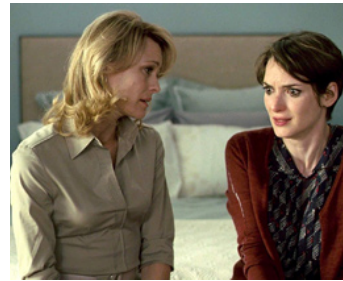
2009 LES VIES PRIVÉES DE PIPPA LEE (The Private Lives of Pippa Lee) de Rebecca Miller avec Robin Wright