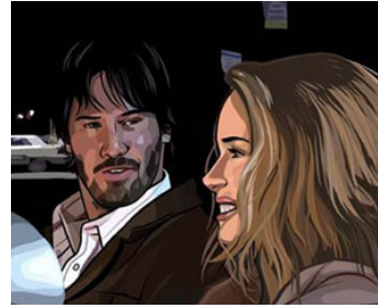
2006 A SCANNER DARKLY de Richard Linklater avec Keanu Reeves